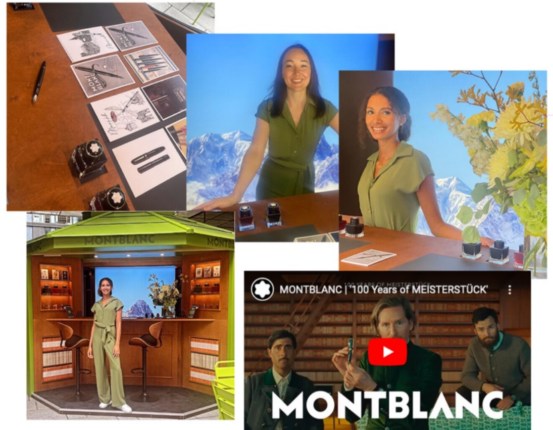
MONTBLANC | 100 Years of MEISTERSTÜCK

Dazu errichtet die Luxusmarke einen exklusiven Pop-up Kiosk, in dem die fundiert gebrieften FPG-Hostessen die geforderten Leads mit Charme und Überzeugungskraft generieren.